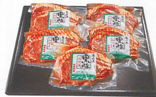
桑水流黒豚みそ漬セット