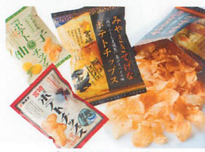
宮崎ポテトチップス