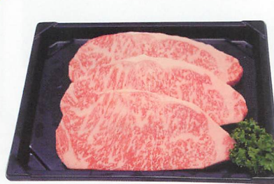
宮崎牛ロースステーキ