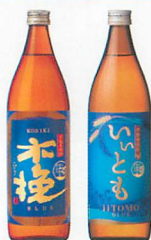
本格芋焼酎 「木挽BLUE」 本格麦焼酎 「いいともBLUE」