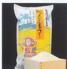
特A 宮崎県産 2015年産米 特A獲得産地 えびの産 ひのひかり