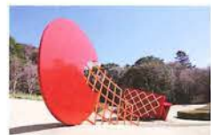
フィリップ・キング 《サン・ルーツ》1999年

【開館時間】 9:00～17:00(入園は16:30まで) 7/20～8/31の土日祝は19:00まで(入園は18:30まで) 【休館日】 月曜日(祝日の場合は翌日)、年末年始(12/29～1/2) 【入園料】 常設展:一般310円 高大生200円 小中生150円 幼児無料 特別企画展はそのつど定めます。