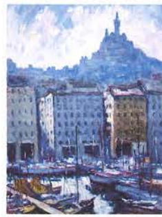
山田新一 「マルセイユの朝」

新しいまちと出会う季節。本展では、美術作品に表現されているまち並みや建物に注目し、美しい景観や身近な場所を通した人々の想いを感じ取ります。