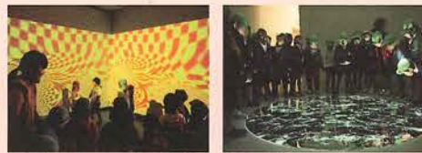
写真は「メッセージ2017」の展示風景 (左上) 児玉幸子・竹野美奈子 「脈動する一壁に耳あり(移送空間)」(部分)