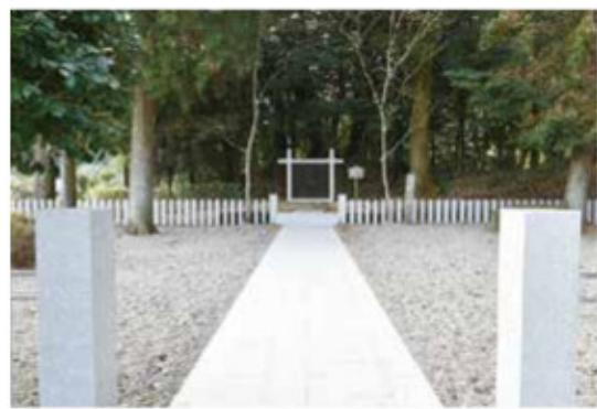
瓊瓊杵尊陵墓参考地