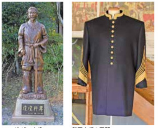
二ニギノミコト像 陸軍大将の軍服

国内最後の内戦となった「西南戦争」で政府軍に敗れた薩摩軍は、北川町俵野の児玉熊四郎邸に宿陣。西郷隆盛は党薩諸隊に解散布告令を出し、明治天皇から拝受した陸軍大将の軍服を焼き、可愛岳を突圍して故郷の鹿児島を目指した。その際、西郷がこの地に宿陣したのは、児玉邸の裏手に皇室の先祖に当たる瓊瓊杵尊の御陵墓があることを知っていたからである。