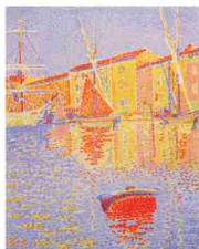
シニャック「フィ (サン・トロベ)」

宮崎県立美術館収蔵作品の展示 [会場] 日南市生涯学習センターまなびピア/綾てるは図書館 ○学芸員によるギャラリートーク 10/27、11/3、20、24