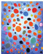
瑛九「赤のあつまり」