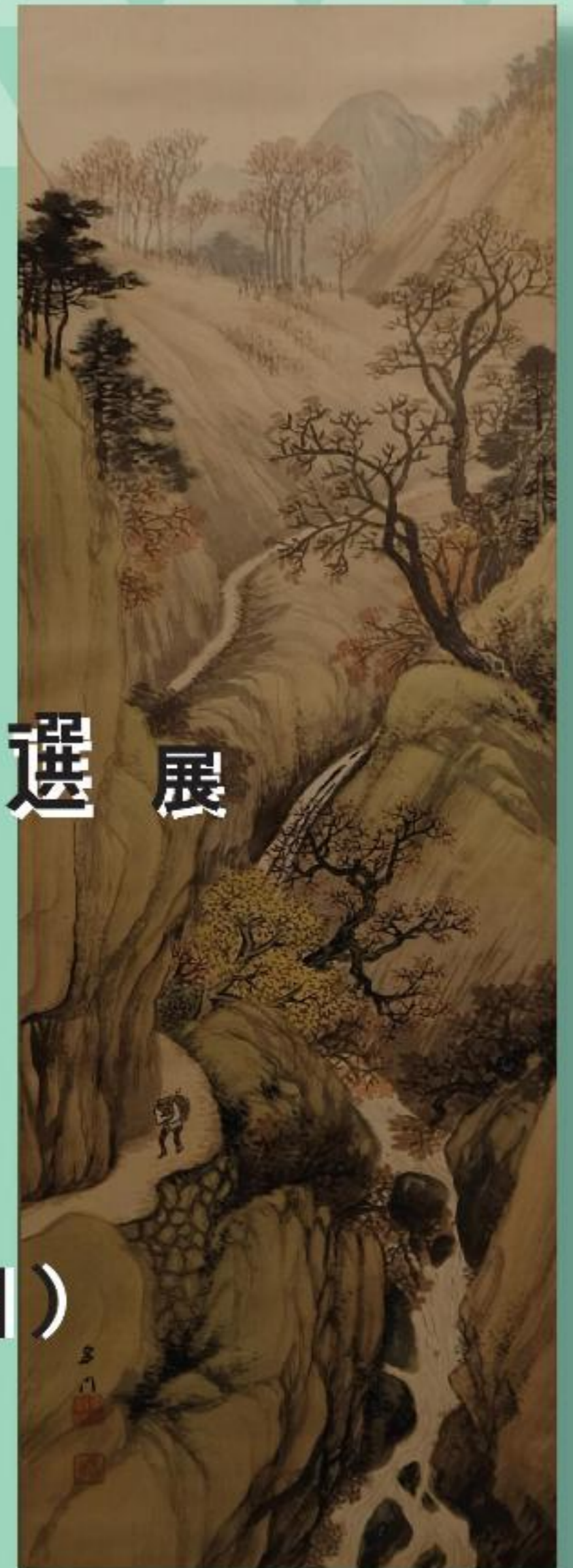
「溪谷晩秋」 山内多門