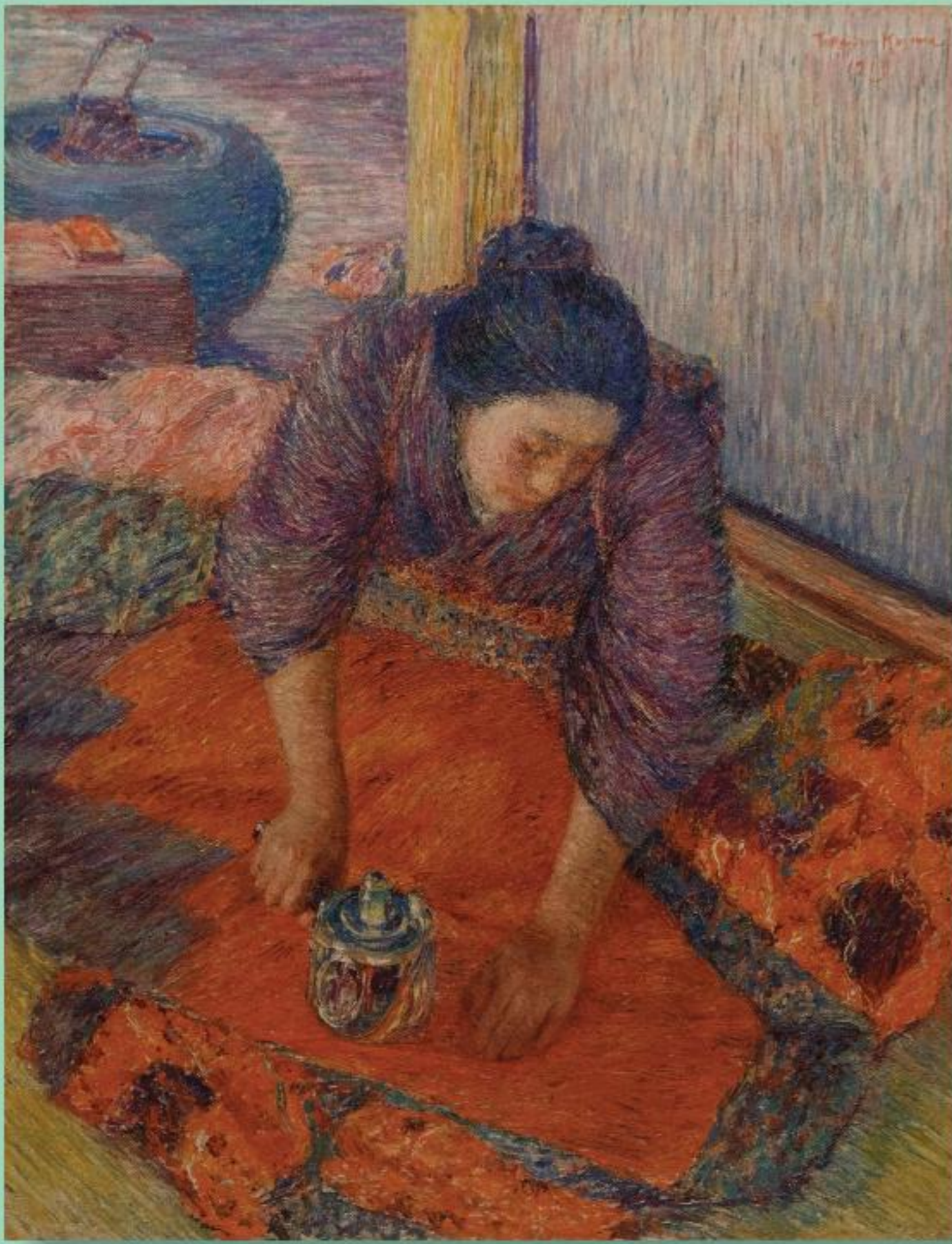
「アイロンがけ」 児島虎次郎