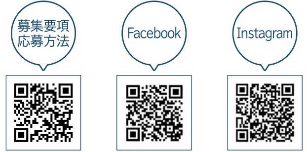
募集要項・応募方法、SNSアカウントのフォローはこちらから

※各賞の対象となる写真の応募数に応じ、作品の数は変更となることがあります。 ※FacebookとInstagramそれぞれの部門で各賞が授与されます。 重複応募はできません。 ※カッコいい!!河川工事の写真は、季節を限定しません。 ※川の写真には、ダム等の写真も含まれます。