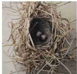
野田弘志「聖なるものTHE-IV」ホキ美術館