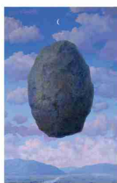
ルネ・マグリット「現実の感覚」