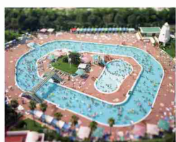
「Tokyo, Japan」(small planetシリーズより) © Naoki Honjo

【特別展示】 国文祭・藝文祭みやざき2020 (特別応援プログラム) 皇室と宮崎 ~宮内庁三の丸蔵館収蔵作品から~ 10/9(土)~12/5(日)