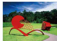
フィリップ・キング「サン・ルーツ」

〒899-6201 鹿児島県始良郡湧水町水場6340番地220 TEL 0995-74-5945 FAX 0995-74-2545 https://www.open-air-museum.org/