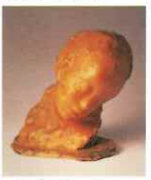
メダルド・ロッソ 「病める子」