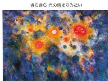
きらきら 光の集まりみたい

〒880-0031 宮崎県宮崎市船塚3丁目210番地 Tel.0985-20-3792 Fax.0985-20-3796