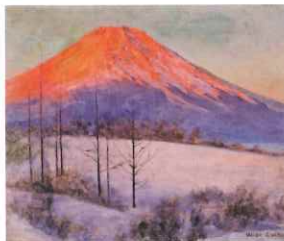
朝日に照らされてきれいだね