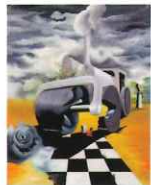
オスカル・ドミンゲス 「地獄の機械」